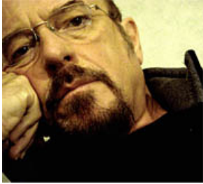
Ian Anderson

Der Schotte Jahrgang 1947 ist das Mastermind der Band Jethro Tull und zeichnet sich dort verantwortlich für den grössten Teil des Songwritings sowie für Gesang und diverse Instrumente. Dabei sind Andersons "Arbeitsgeräte" ein unverzichtbarer Teil des charakteristischen "Tull-Sounds", hat er sich doch immer als