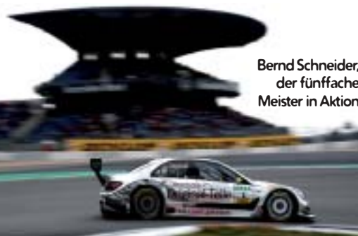
Bernd Schneider, der fünf-fache Meister in Aktion

... und Tickets unter www.dtm.com und www.nuerburgring.de , Tickethotline der DTM unter 01805/723000. Die Preise liegen zwischen 20,- und 46,- EUR für Wochenendtickets und reichen von 10,- bis 36,- EUR für die Tageskarten am Freitag und Samstag je nach Tag und Tribüne. Die Eintages-tickets für den Rennsonntag sind bereits ausverkauft! Dazu werden noch Family-Wochenendtickets für 85,- und 105,- EUR angeboten für maximal zwei Erwachsene und zwei Jugendliche bis einschließlich 14 Jahre. Der Eintritt ins Fahrerlager kostet 20,- EUR (erhältlich nur in Verbindung mit einem Tribünettiket).