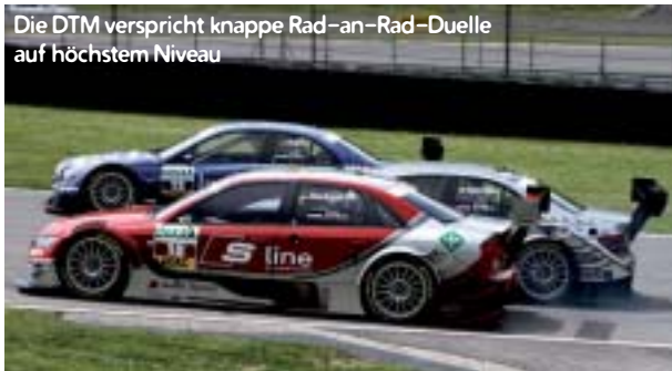
Die DTM verspricht knappe Rad-an-Rad-Duelle auf höchstem Niveau