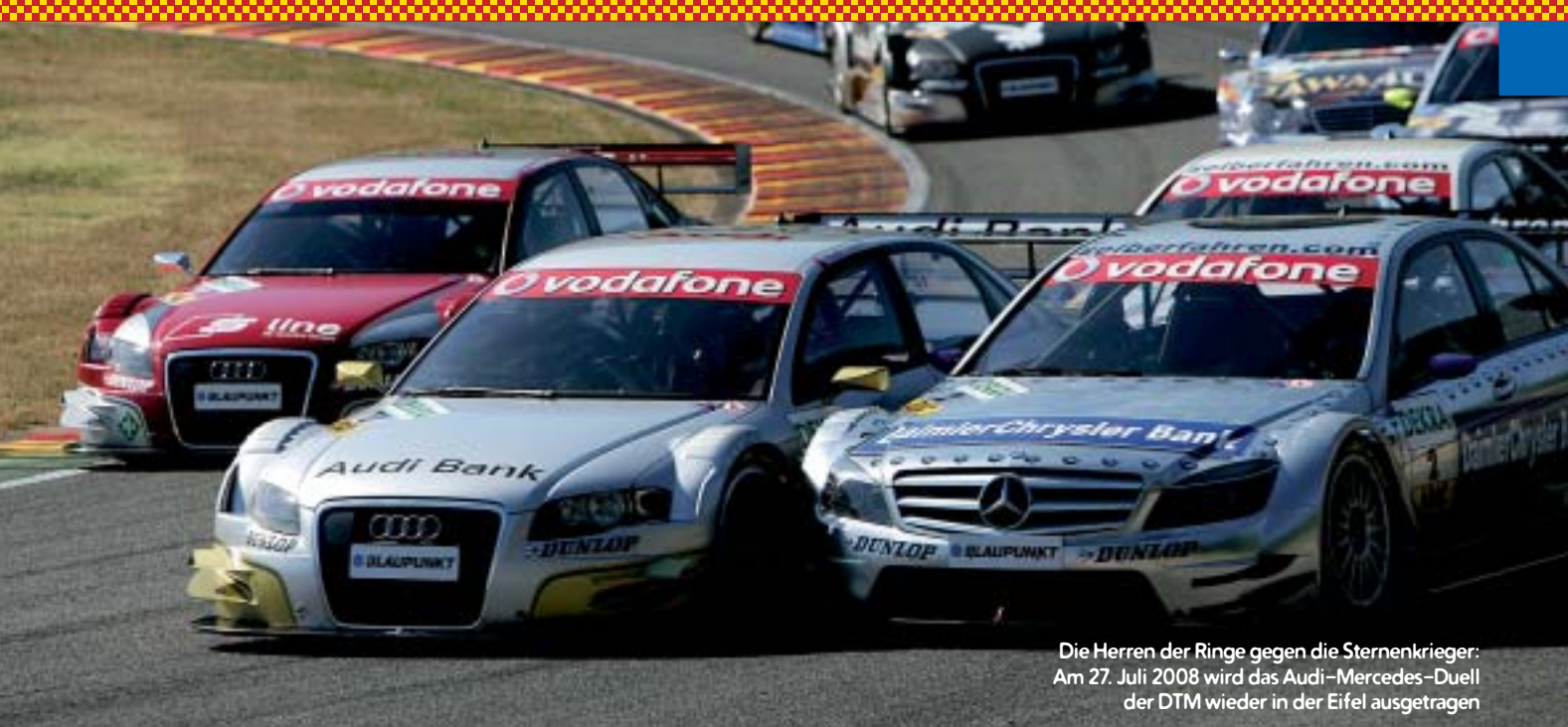
Die Herren der Ringe gegen die Sternenkrieger: Am 27. Juli 2008 wird das Audi-Mercedes-Duell der DTM wieder in der Eifel ausgetragen

Am 27. Juli ist es wieder so weit: Die „Deutsche Tourenwagen Masters“, die DTM wird wie gewohnt die Grand-Prix-Strecke des Nürburgring mit ihren satten 10.000 PS zum Beben bringen. Zwei Marken und 21 Fahrer/innen kämpfen um die Punkte und letztendlich um die Krone dieser Saison. Bunter kann ein Fahrerfeld kaum sein. Zum einen finden sich hier die Ex-Formel 1-Fahrer Christijan Albers und der prominente Neuzugang Ralf Schumacher, der sich in seinem Debütjahr natürlich besonders im Fokus der Zuschauer befindet. Zum anderen treten hier wahre Tourenwagen-Spezialisten an wie der amtierende Meister Mattias Ekström oder das DTM-Urgestein, der fünfmalige Champion Bernd Schneider. Langstreckenexperten - allen voran der achtfache Le Mans-Sieger Tom Kristensen - sind ebenso vertreten wie junge aufstrebende Talente, z.B. der schnelle Schotte Paul di Resta oder Mathias Lauda, Sohn des dreifachen F1-Weltmeisters Niki