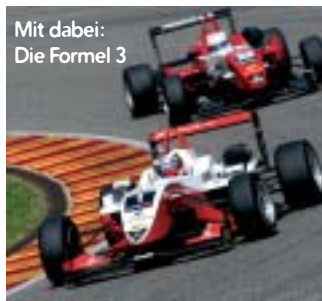
Mit dabei: Die Formel 3